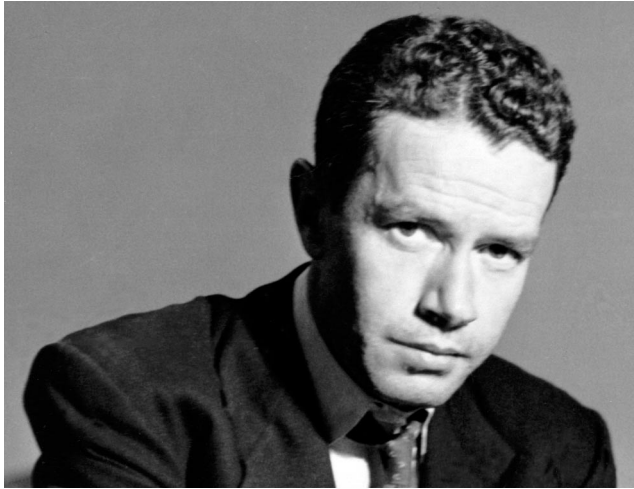
Fotografía con que los editores del boletín del Centro Mexicano de Escritores ilustraron la nota "Fifteen Young Mexican Writers" ( Recent Books in Mexico , III, 3, March 15, 1957, p. 2).