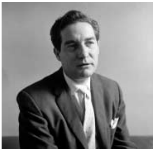
Octavio Paz. Década de 1950.