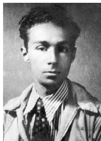
Primo Levi nel 1943