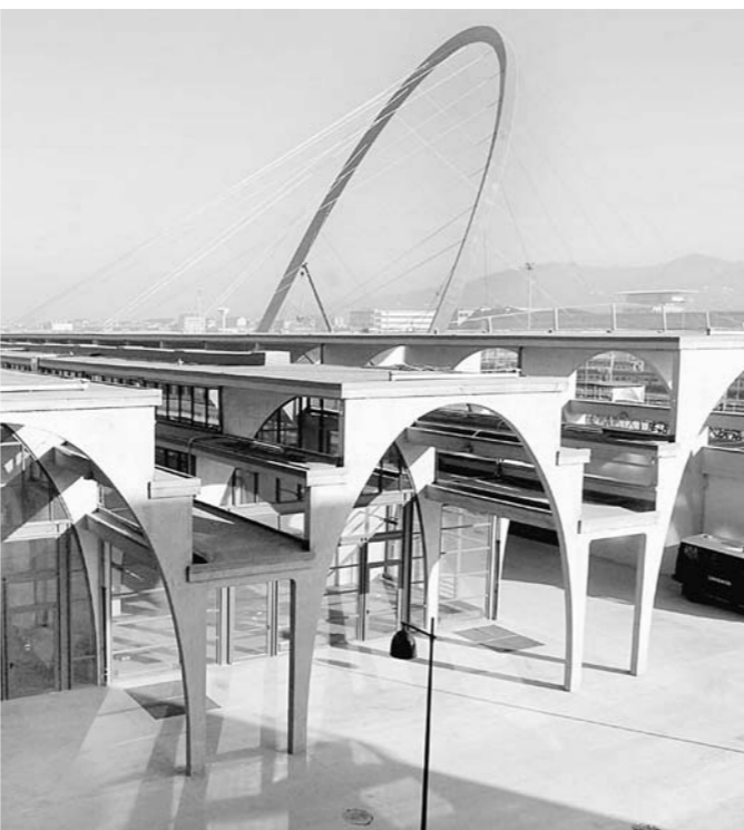
L'arco olimpico che domina il villaggio in cui saranno ospitati gli atleti di Torino 2006

per chiudere con la morte dell'Avvocato Agnelli, la storia di Torino mette in luce la sua originalità.