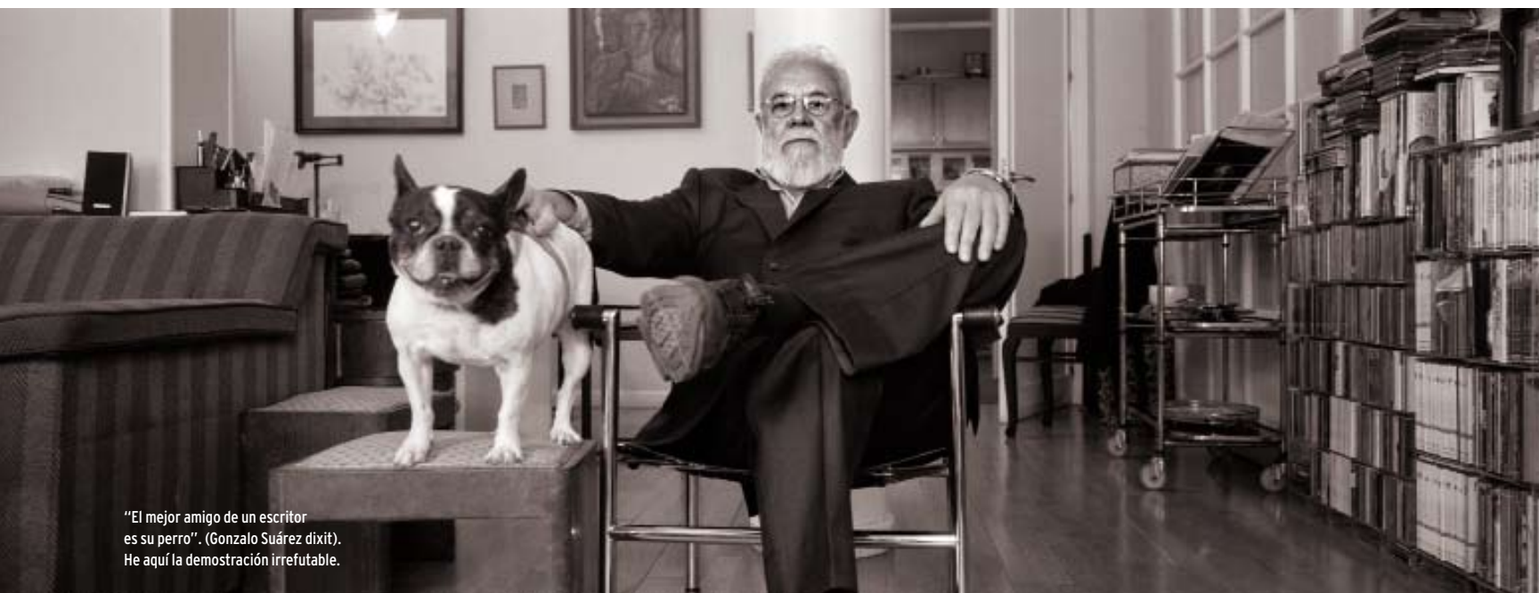
"El mejor amigo de un escritor es su perro". (Gonzalo Suárez dixit). He aquí la demostración irrefutable.