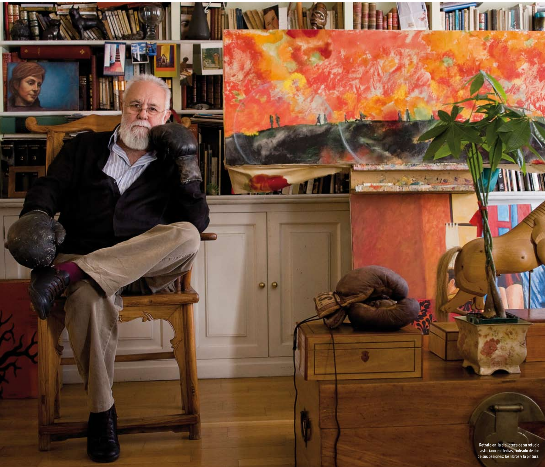
Retrato en la biblioteca de su refugio asturiano en Lledias, rodeado de dos de sus pasiones: los libros y la pintura.